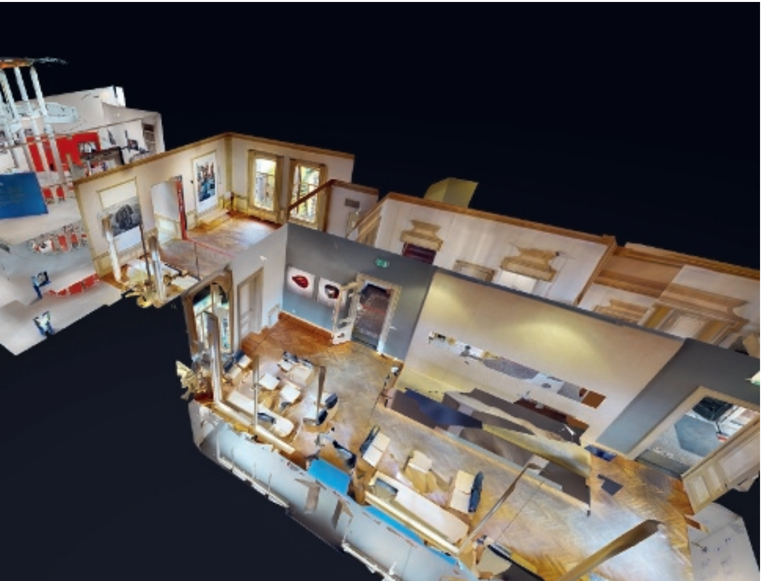
het museum als poppenhuis in de matterport projectie

tentoonstelling toch nog in het echt wil zien is er gelegenheid genoeg. Zodra het weer kan reist 'De Zilveren Camera 2019' door heel Nederland, te beginnen in Venlo."